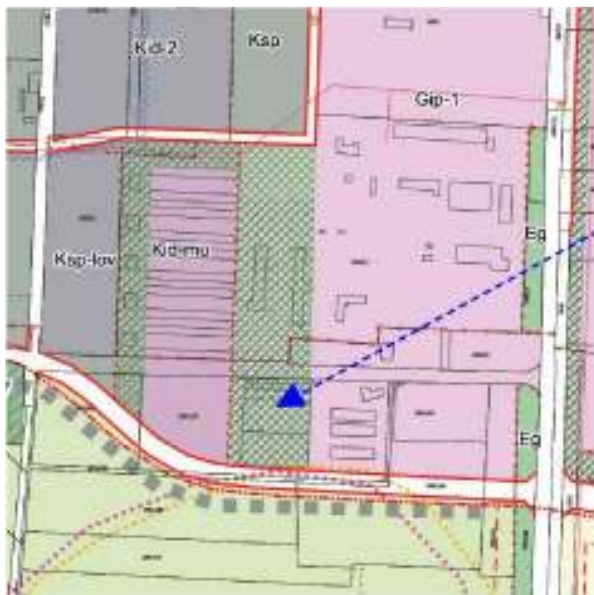
Hatályos szabályozási terv részlete

A Hajdúnánás, 0991/60 hrsz.-ú Béke Mg. Szövetkezet tulajdonában lévő ingatlan nyugati szélén, a szabályozási terven kijelölt „ Telken belüli védőzöld- beültetési kötelezettséggel ” kijelölt terület beépíthetőségének lehetővé tételét kezdeményezi a kérelmező. Az ingatlanon mintegy 30x60 m tároló épület elhelyezésére szeretne lehetőséget teremteni a jövőben.