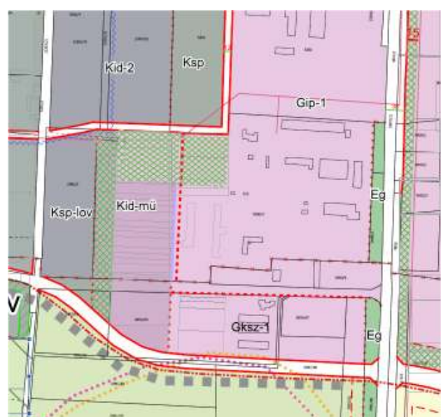
A szabályozási terv javasolt módosítása

A védő zöldterület kijelölése, a Balmazújváros úton szabályozott ipari gazdasági övezet hatásaitól hivatott megvédeni, a Strand- és Gyógyfürdő területtől déli irányban elhatározott idegenforgalmi és sportolási célú területeket.